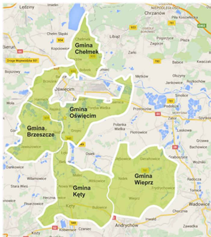
Mapa obszaru objętego Lokalną Strategią Rozwoju z zaznaczeniem granic gmin wchodzących w skład LGD „Dolina Soły”

Lokalna Strategia Rozwoju ma charakter wielofunduszowy, współfinansowana jest z Europejskiego Funduszu Rolnego na rzecz Rozwoju Obszarów Wiejskich (EFRROW), Europejskiego Funduszu Rozwoju Regionalnego (EFRR) oraz Europejskiego Funduszu Społecznego Plus (EFS+). Realizacja operacji w ramach funduszy EFRROW, EFRR oraz EFS+ będzie możliwa na całym obszarze objętym LSR.